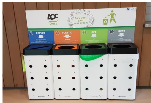
Voorbeeld van afvalbakken met duidelijke kleuren en symbolen (AOC Oost)